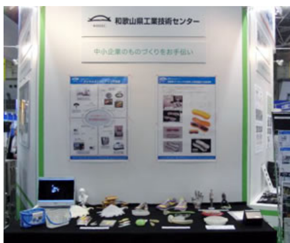
写真2 工業技術センターの展示コーナー