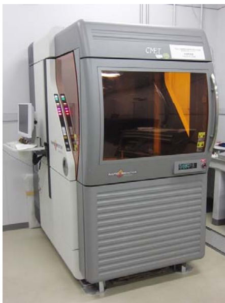
3Dプリンター光造形タイプ