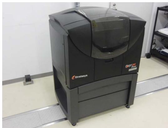
3Dプリンターインクジェットタイプ