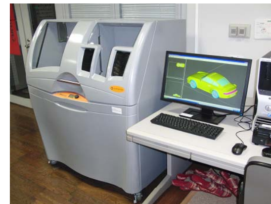
3Dプリンター粉末固着タイプ